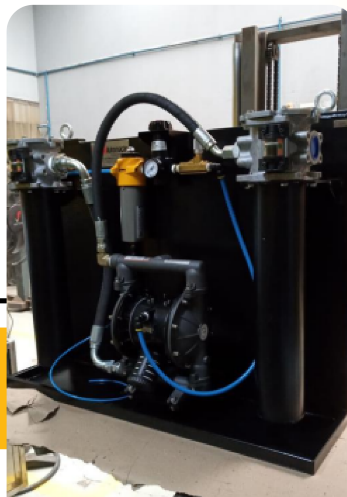
Filtração e unidades de teste