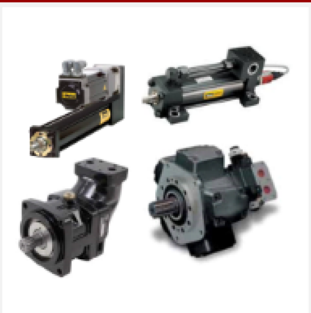
Cilindros e Motores Hidráulicos e Pneumáticos