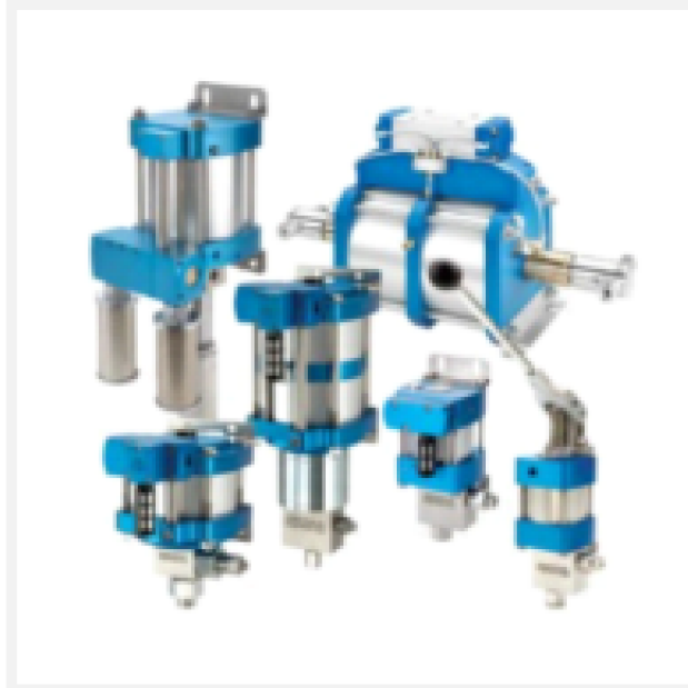
Bombas Hidropneumáticas Autoclave