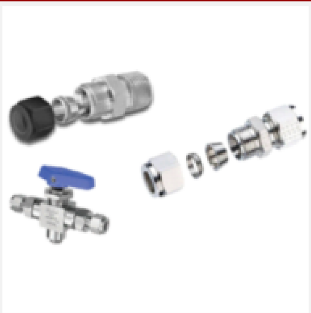
Linha CPI e A-Lok de Simples e Dupla Anilha