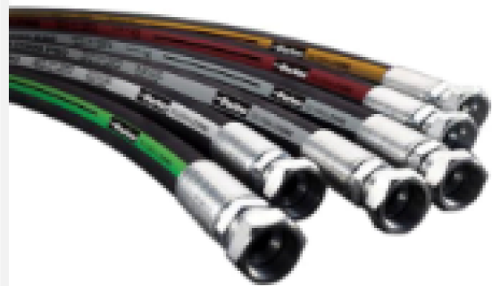
Mangueiras de Borracha