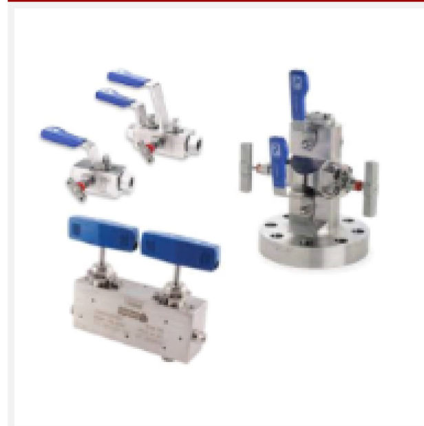
Válvulas de Duplo Bloqueio e Sangria