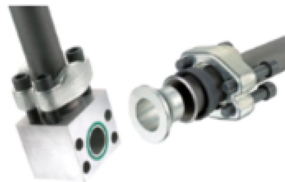
Soluções isenta soldas para Tubos - F37