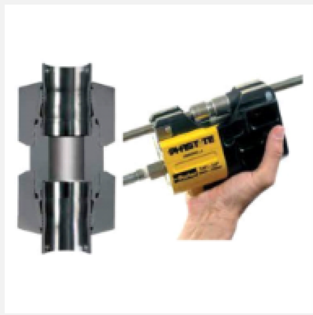
Linha Phastite de Conexões Permanentes sem Anilha