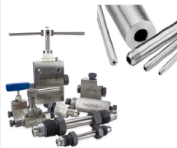
Linha Autoclave Padrão Cone e Rosca